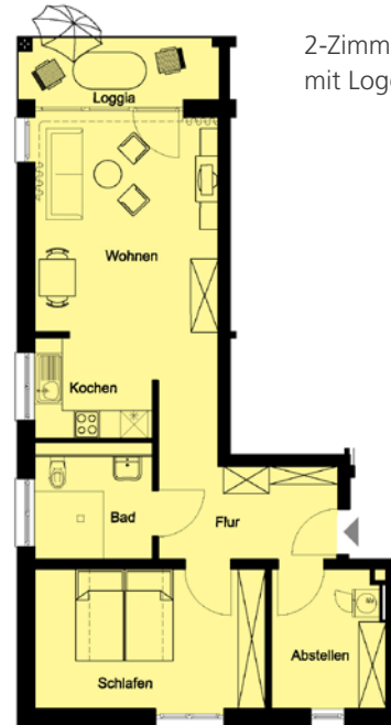
2-Zimmer-Apartment mit Loggia