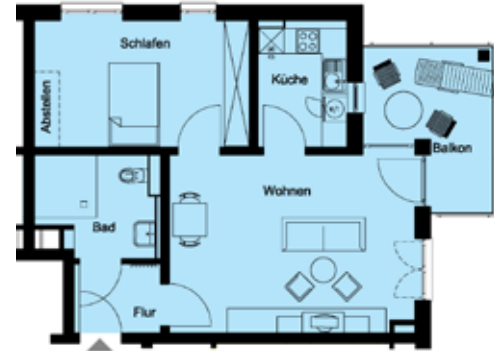
2-Zimmer-Apartment mit Balkon

Energieangaben: EA-B, 73,9 kWh/(m 2 a), Hzg. FW, EEK B, Bj. 2013