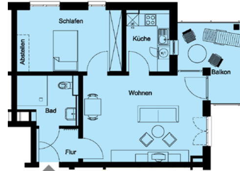
2-Zimmer-Apartment mit Balkon

Separater Abstellraum zu jedem Apartment