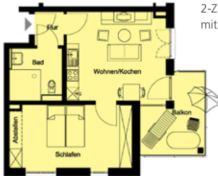
2-Zimmer-Apartment mit Balkon